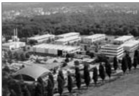
Une vue générale du site

U n nouvel espace de développement économique, l'Espace Descartes, vient d'ouvrir à Limeil-Brévannes. Composé d'une pépinière d'entreprises, d'un hôtel d'entreprises et d'un incubateur, il occupe un site de 4,5 hectares sécurisé où sont déjà installées depuis plusieurs années deux entreprises de pointe : OMMIC* (Philips) et SODERN** (EADS). Ces entreprises qui font partie des grands groupes et PMI innovantes sont partenaires du réseau « System@tic », un des pôles de compétitivité représentatif du territoire. Comptant sur ces deux établissements leaders, Limeil-Brévannes projette de se situer comme pôle représentatif de la filière optique et télécommunications en Val-de-Marne. A terme, c'est à dire, fin 2007, 10 000m 2 de bureaux destinés à du tertiaire service ou activités médicales seront mis sur le marché.